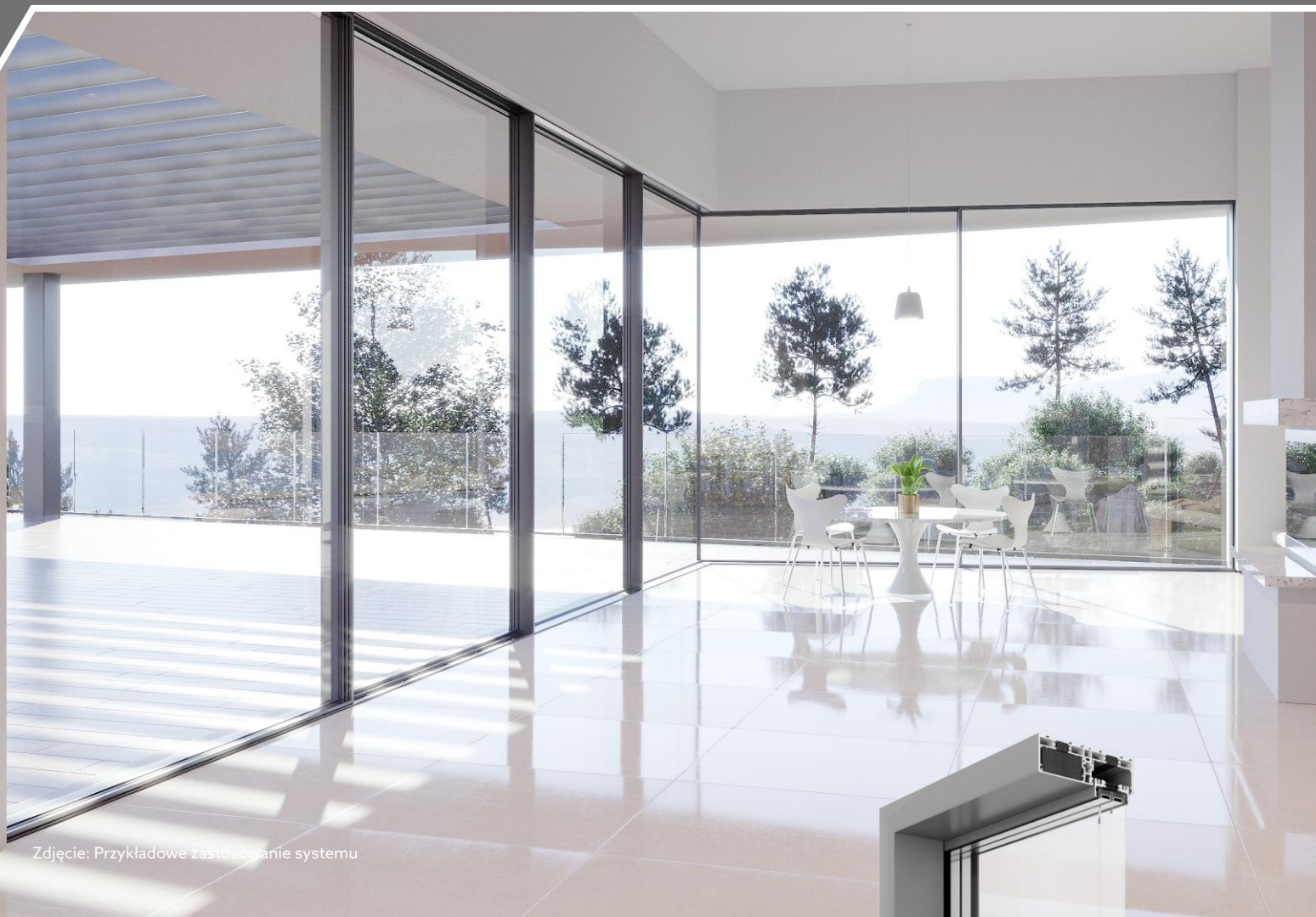
Zdjęcie: Przykładowe zastosowanie systemu